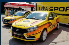
Экскурсии на лада спорт

Телефон представителя туристической компании для организации экскурсий