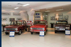
Музей ОАО «Автоваз»