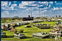
Технический музей имени К. Г. Сахарова